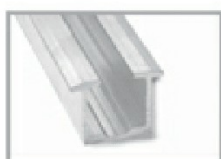
Binario in alluminio anodizzato nero art. BN30/01