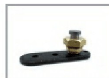
Piastra con fermo art. GPL 02

kit per porta a libro distanziata art. DLGPLDS