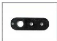
Piastra per aggancio art. GPL 03