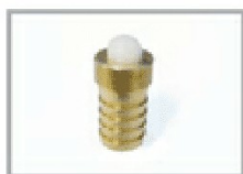
Freno di arresto a molla art. GPL 07