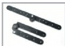
Doppia squadretta ravvicinata

Esempio illustrativo porta a libro apertura 2/3