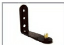
Piastra a L con gancio art. GPL 04