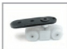
Piastra con carrello con cuscinetti a sfera