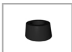
Nr 2 gommini paracolpi