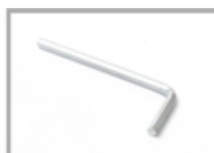
Nr 1 Chiave di montaggio