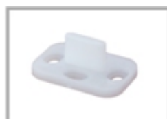
Nr 1 guida inferiore