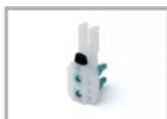
Nr 1 fermo corsa