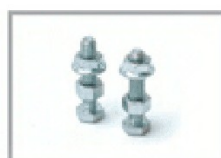
Bulloneria art. BL/160

kit per porte scorrevoli Kg 160 art. DL/160