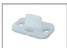
Nr 1 guida inferiore art. G/40-160