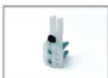
Nr 2 fermo corsa art. FC/160