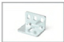
Staffetta di fissaggio art. ST/01 Implantation stirrup art. ST/01