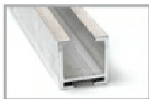
Nr 1 Binario art. BN/160-200 Nr 1 Traks mt 6 art. BN/160-200