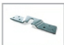
Nr 2 staffe art. ST/160