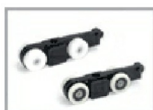
Nr 2 carrelli art. C/160R Nr 2 carrelli art. C/160S

Carrello stampato in nylon con ruote indipendenti a sfera rivestite in nylon portata 160 Kg