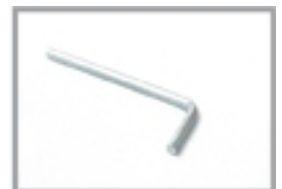
Nr 1 Chiave di montaggio art. APS04