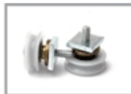
Nr 2 Ruote per scorrimento cavetto art. APS01