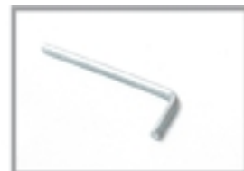
Nr 1 Chiave di montaggio art. APS04