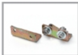
Nr 2 Staffe aggancio cavetto art. APS03