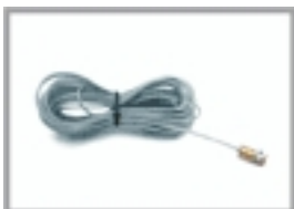
Nr 1 Cavetto in acciaio mt 9 art. APS02

Esempio illustrativo di montaggio con apertura simultanea